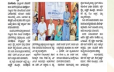
ಯೇನುನುನು ಎಸ್ಟೇಷನ್ ಮಹಿಳಾ ಕಿರೀಟರಾಜ್ಯದ ಪ್ರಾಥಮಿಕ ಅಧ್ಯಯನ