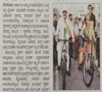
ರಾಜ್ಯದ 7 ಕಡೆ ಸೈಕಲ್ ಜಾಥಾ ಆಯೋಜನೆ

ಪ್ರಾಕೃತಿಕ ಅಮೃತ ಮಳೆಗಾಲದ ನಿರ್ಮಿತ ಸೈಕಲ್ ಜಾಥಾ ಆಯೋಜನೆ