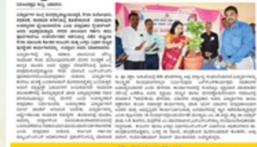
ಎನ್ ಎಸ್ ಎಸ್ ಶಿಬಿರ ಮಧ್ಯದ ಪುಸ್ತಕೋಪಹಾರ ಕಾರ್ಯಕ್ರಮದ ರಾಷ್ಟ್ರೀಯ ಸೇವಾ-ಐಕ್ಯತಾಭಾವ ಮೂಡಿಸಿ