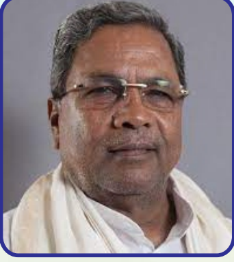
ಶ್ರೀ ಸಿದ್ದರಾಮಯ್ಯ ಮಾನ್ಯ ಮುಖ್ಯ ಮಂತ್ರಿಗಳು, ಕರ್ನಾಟಕ ಸರ್ಕಾರ