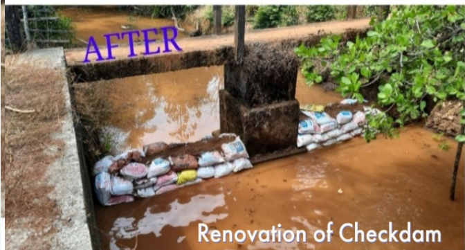
Renovation of Checkdam